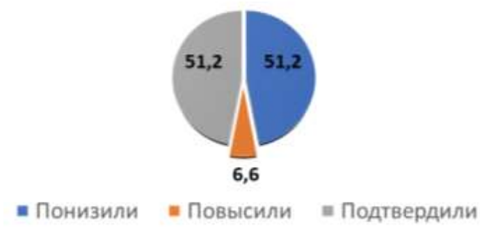
Качество ВПР, %